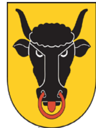
Wappen Kanton Uri